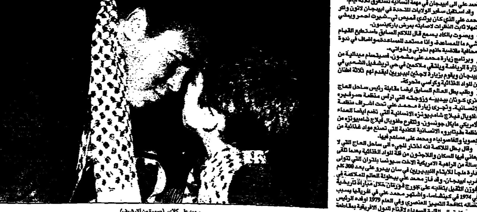
محمد علي يزور ابديجان

فوز الهلال السوداني على الوحدة اليمني 1 - صفر